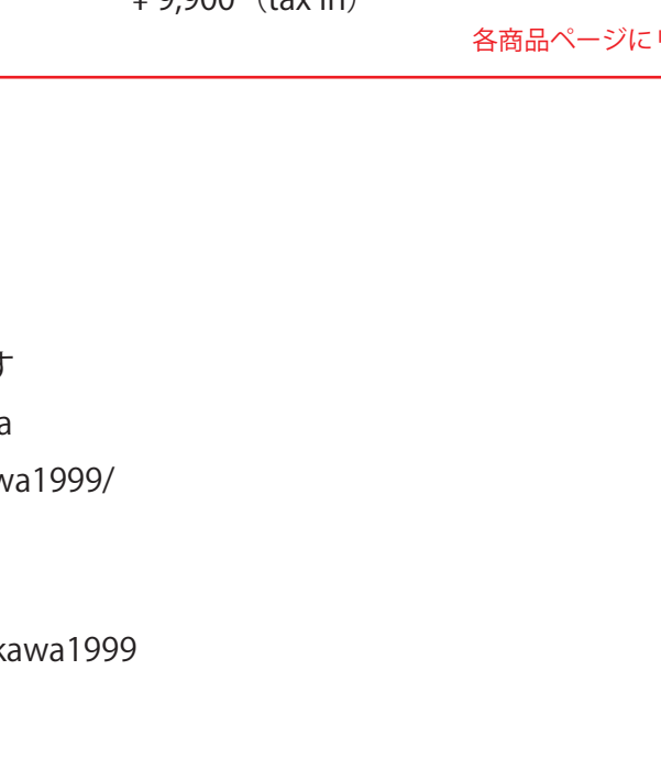
ミニマムウォレット Reduce ¥ 23,650 (tax in)