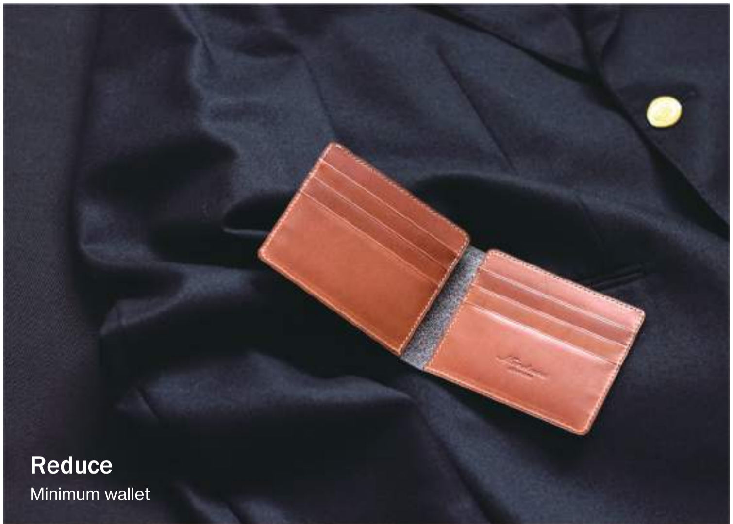
Reduce Minimum wallet

カッコいいだけでも、機能的なだけでもなく ライフスタイルに合った最高の財布と出会おう。