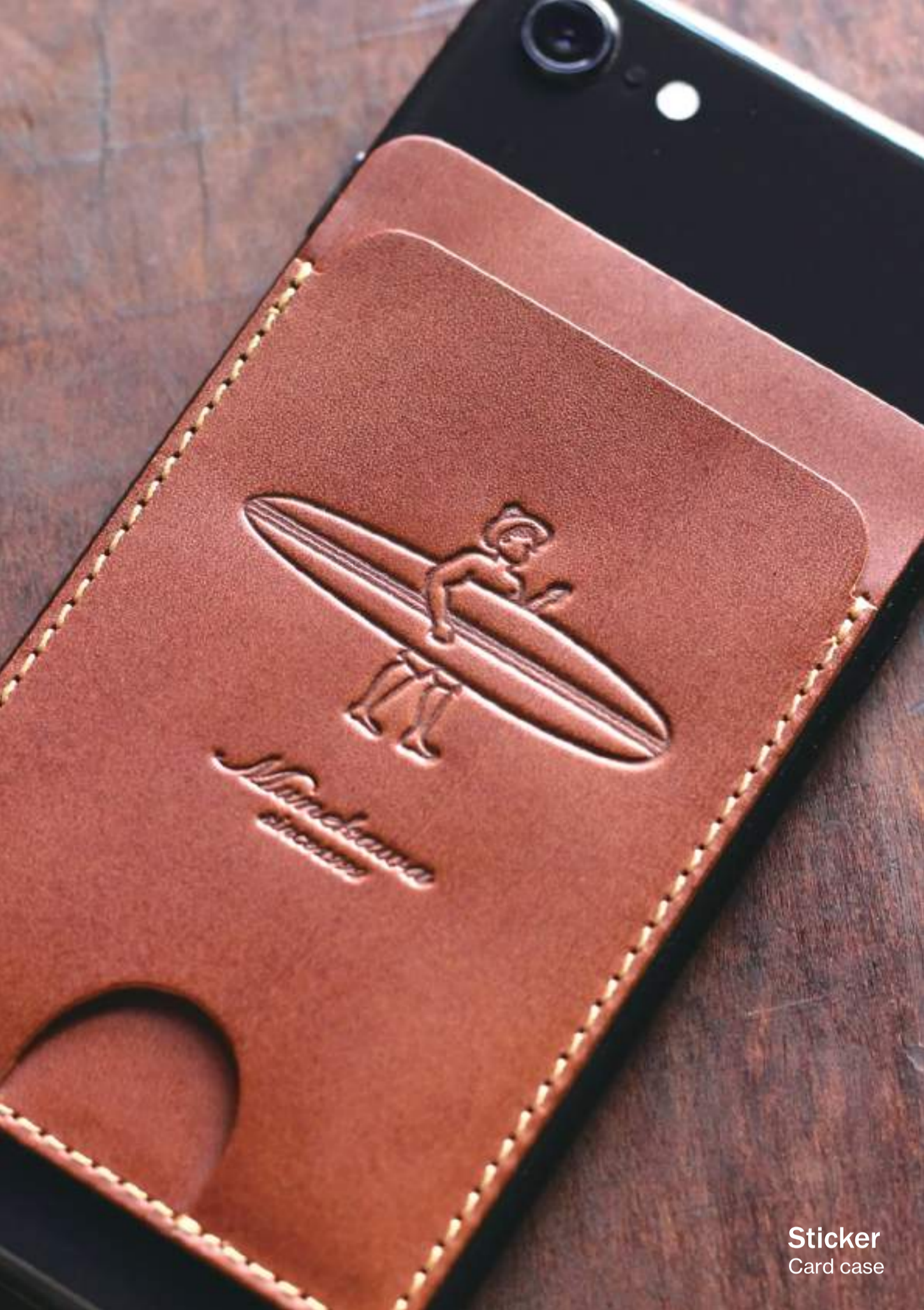
Sticker Card case