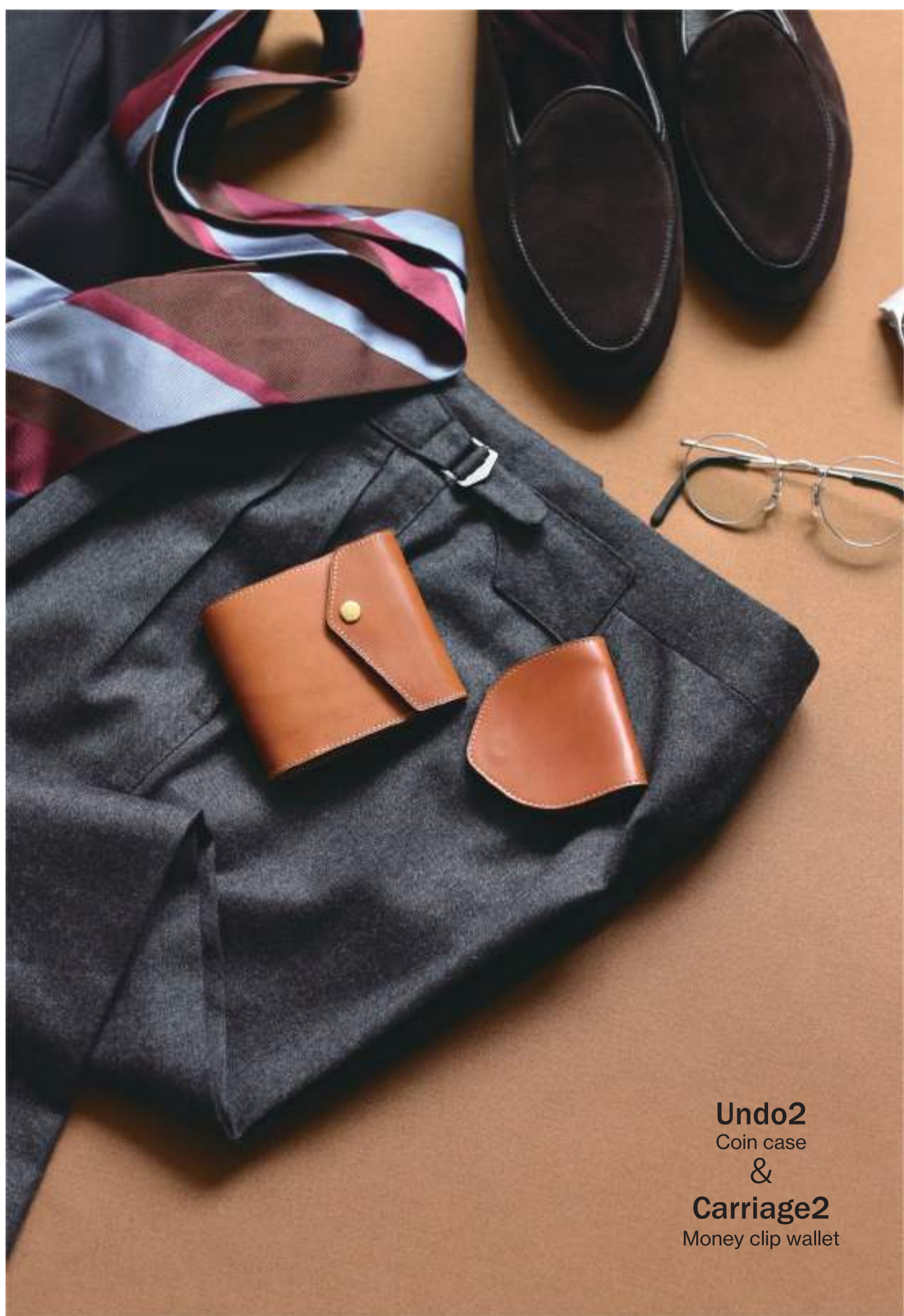
Undo2 Coin case & Carriage2 Money clip wallet