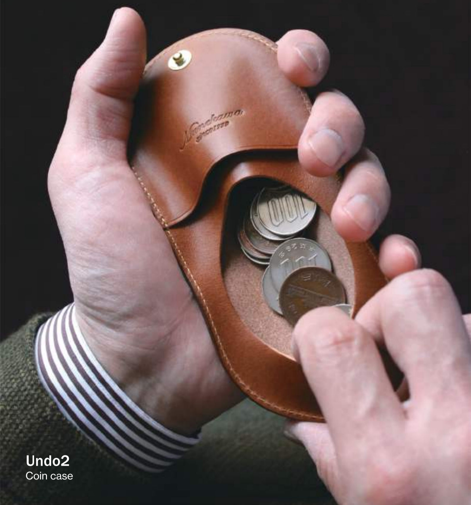
Undo2 Coin case