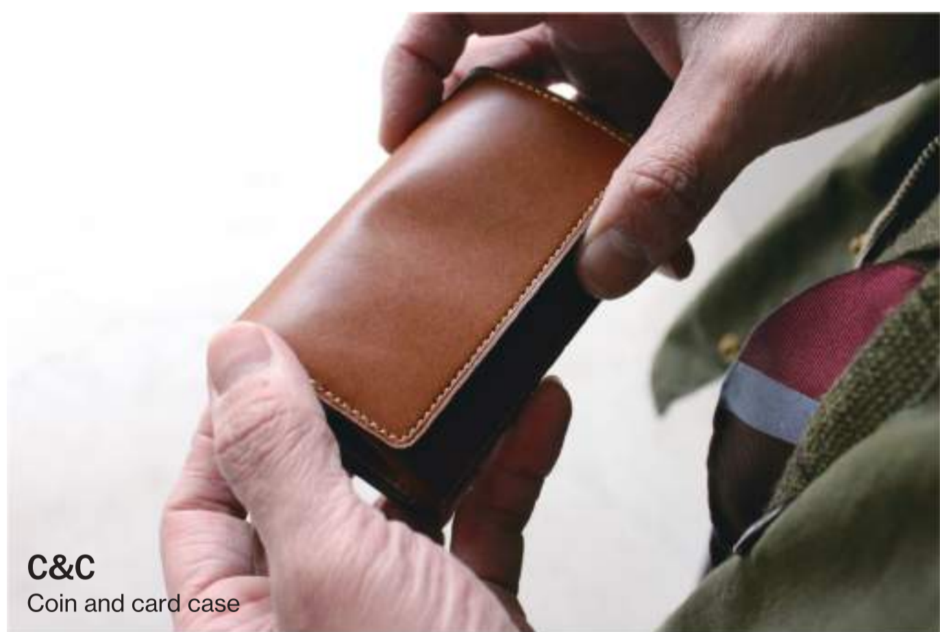
C&C Coin and card case