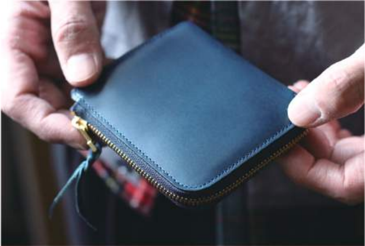
Cram L-Zip wallet