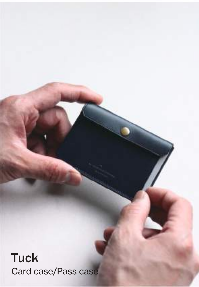
Tuck Card case/Pass case