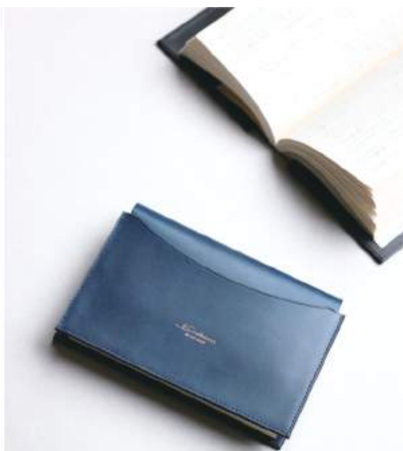
Dress Book jacket S