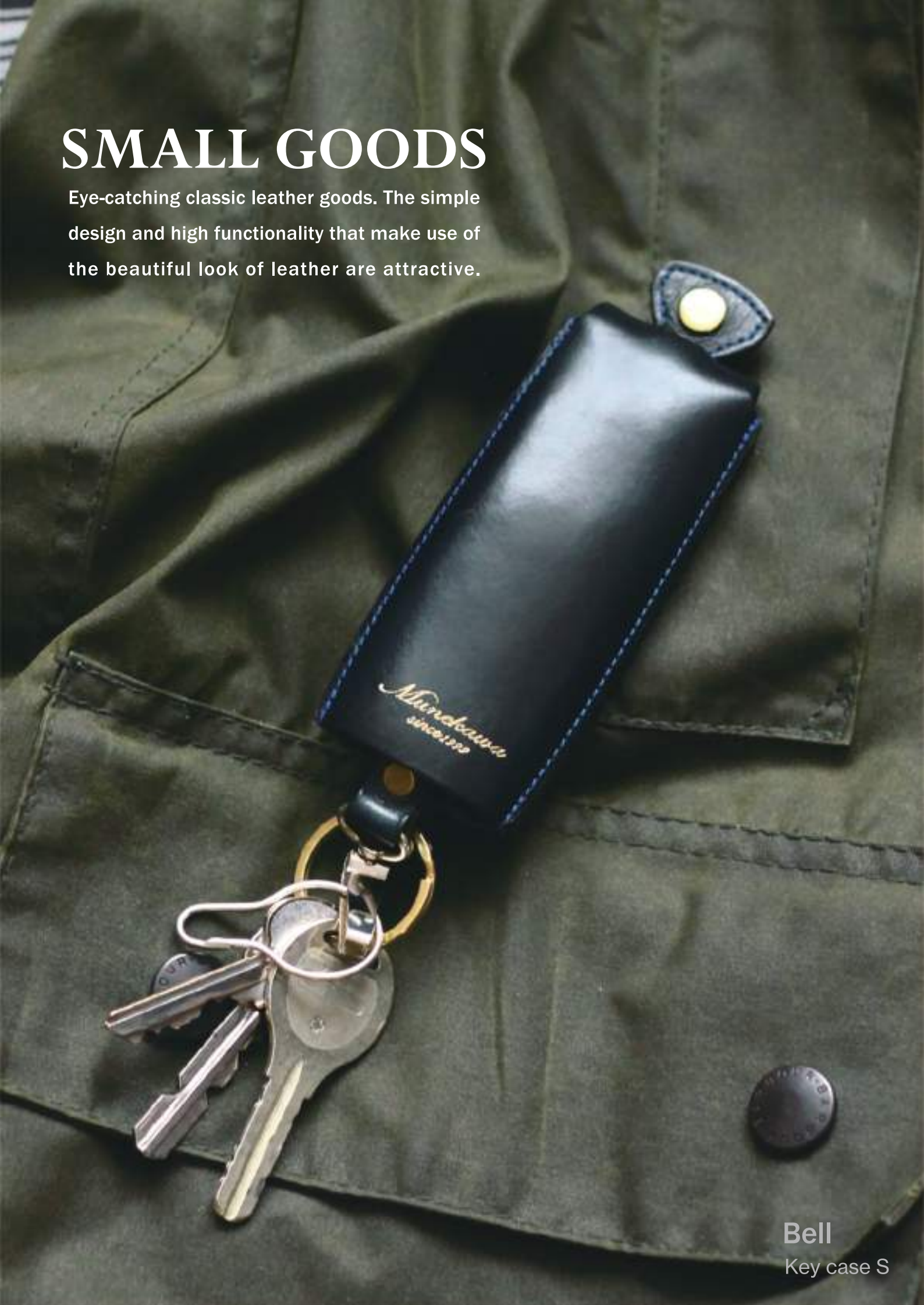
Bell Key case S

Eye-catching classic leather goods. The simple design and high functionality that make use of the beautiful look of leather are attractive.