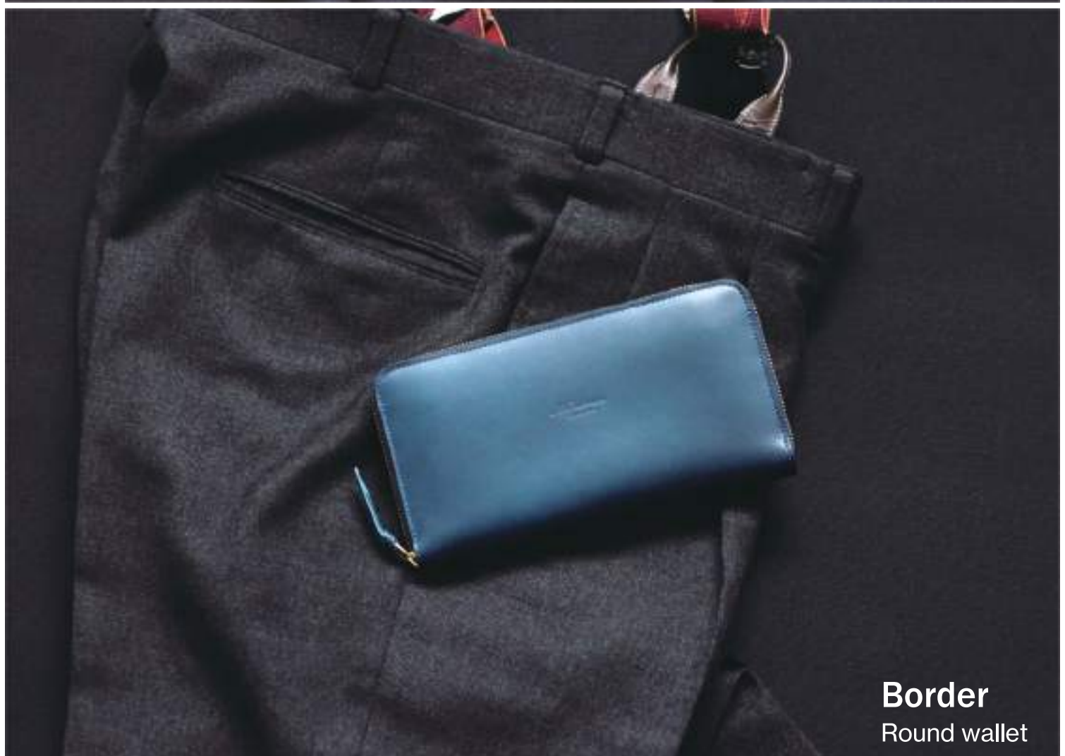
Border Round wallet