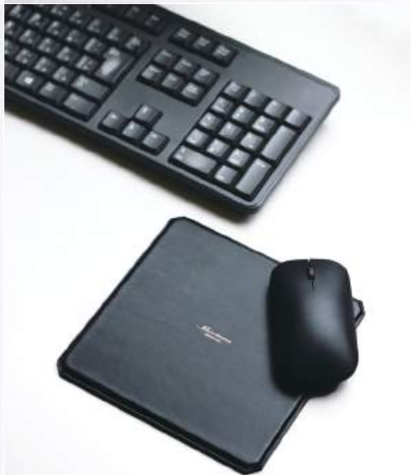
MP500 Mouse pad