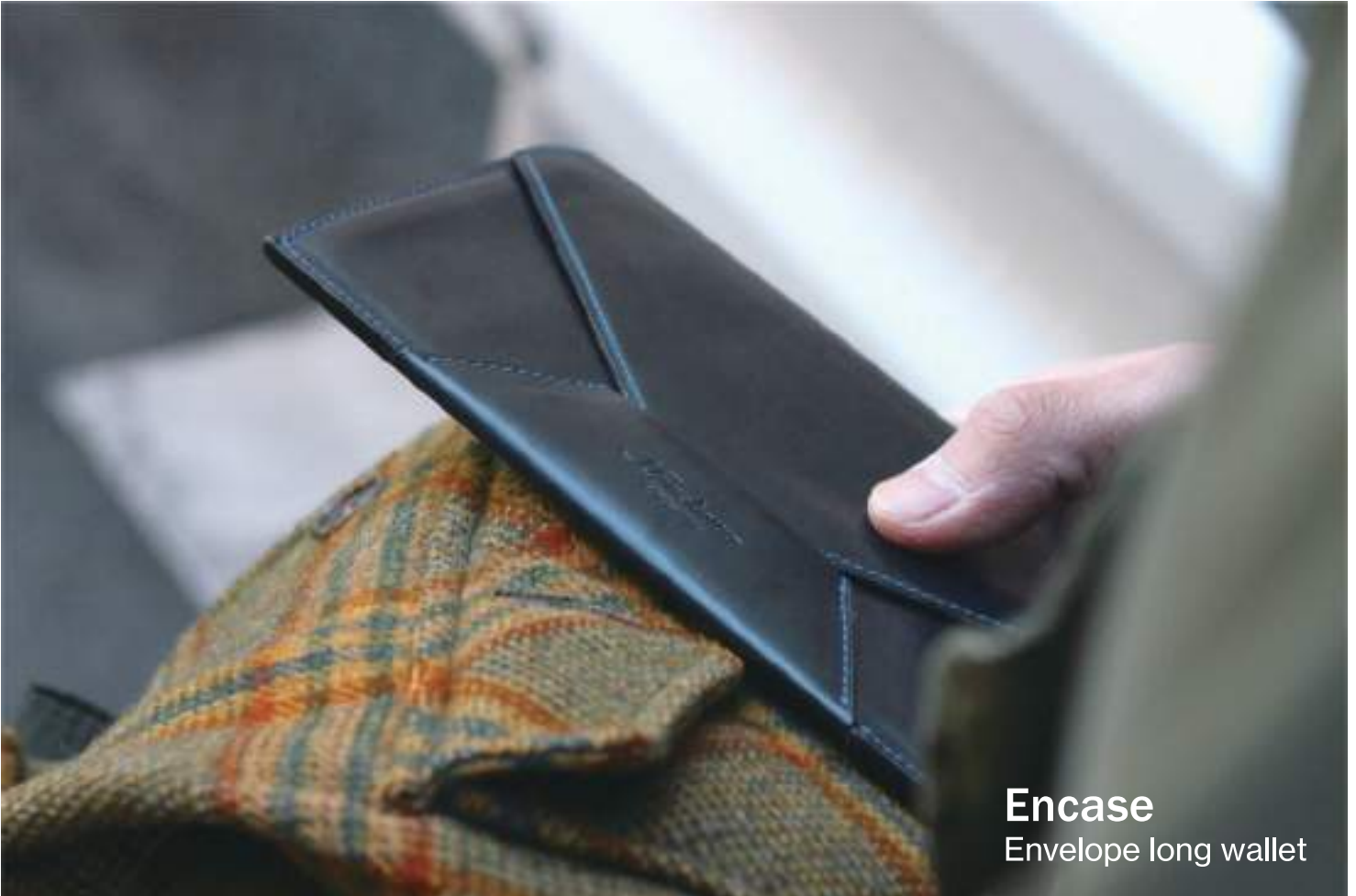
Encase Envelope long wallet