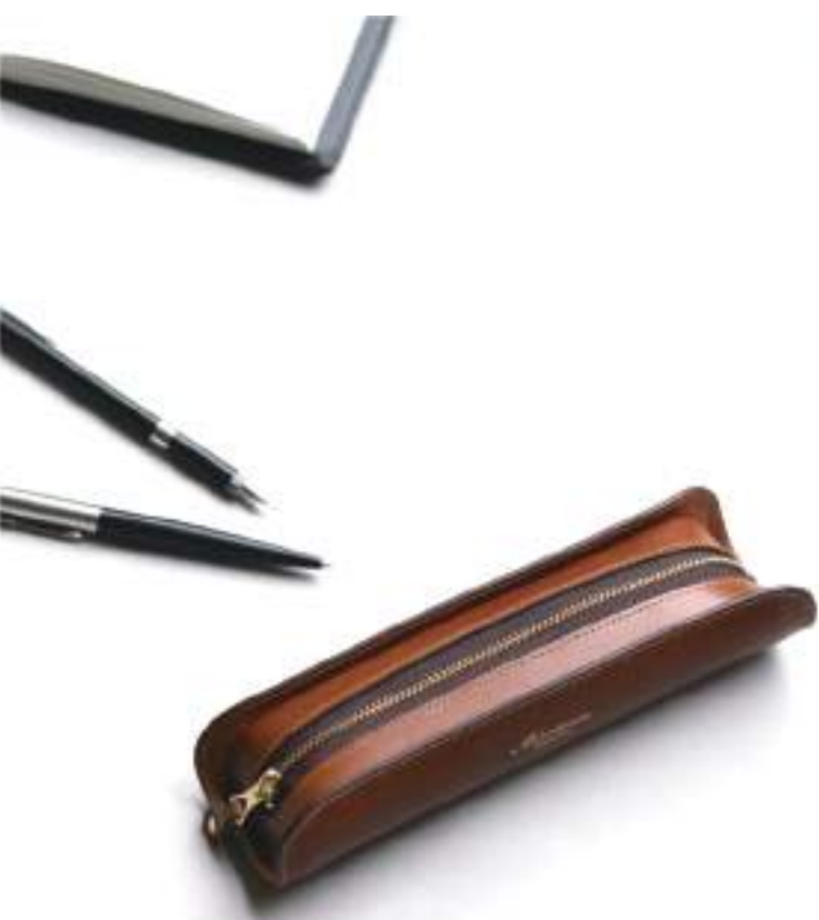
U-shape Pen case

パッと目を引く、クラシカルな革小物。 革の美しい表情を活かした、シンプルな デザインと機能性の高さが魅力です。