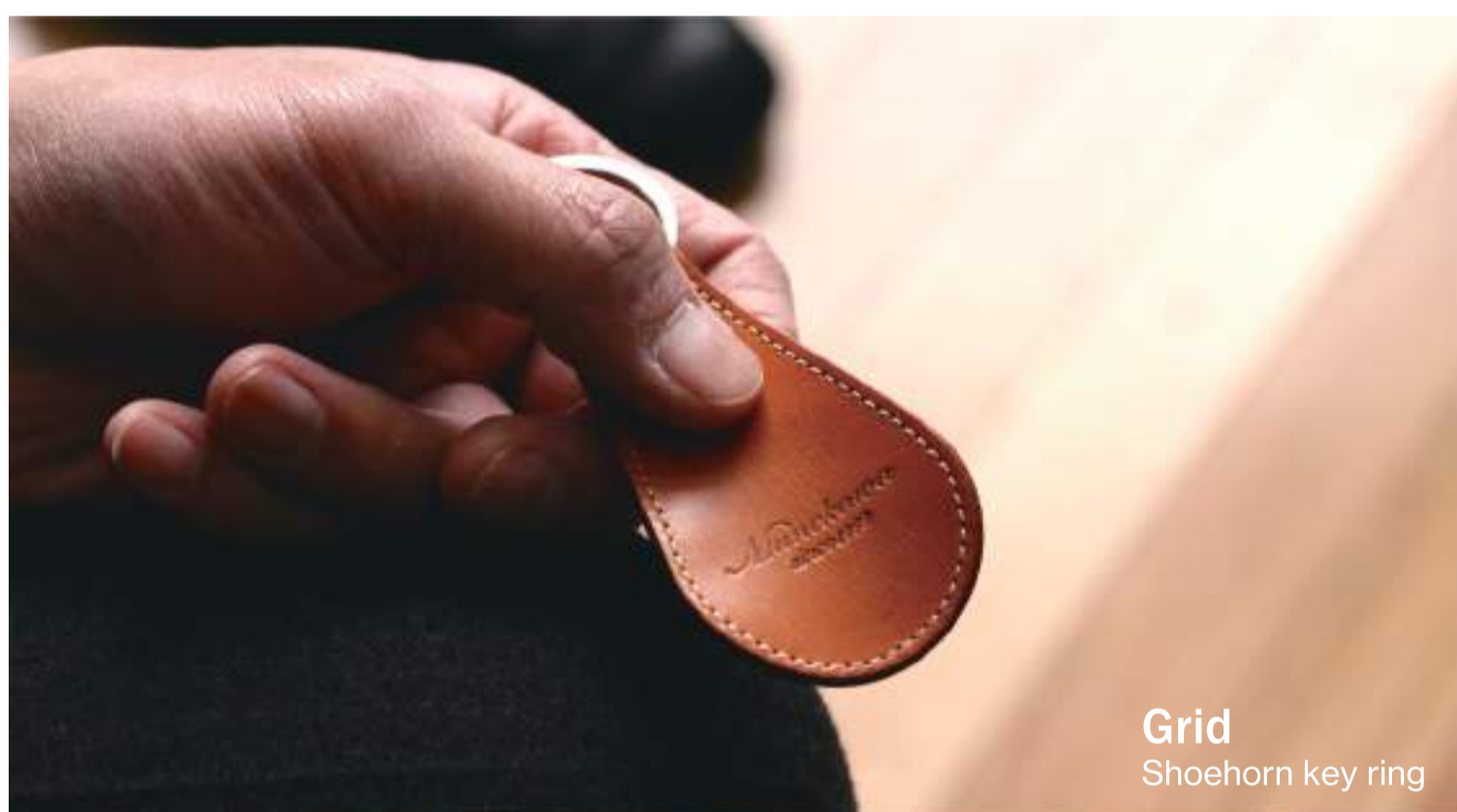
Grid Shoehorn key ring