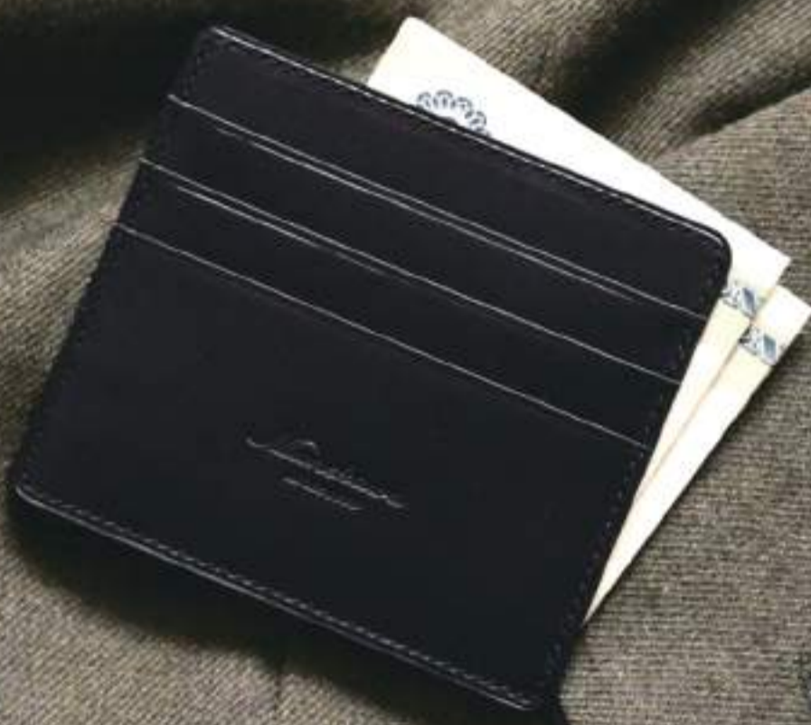
Wedge Thin and small wallet

Find your best wallet that suits your lifestyle, not just cool and functional.